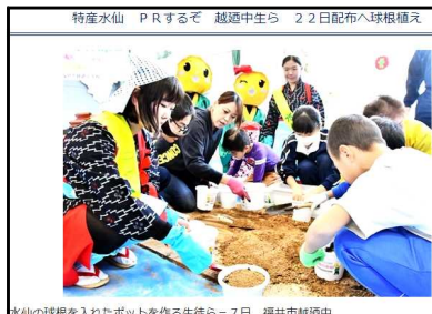
水仙の球根を入れたポットを作る生徒ら＝27日、福井市越廼中

吉本興業“飯めしあがれこにお”さん とのコラボレーション開始 9/28「福井新聞」に掲載