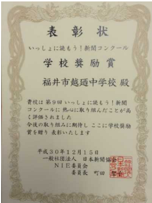
「いっしょに読もう！新聞コンクール」 学校奨励賞 受賞