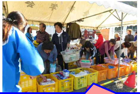
PTAバザーは、今年も大盛況！ 売り上げは部活動等にに使わせていただきます。御協力本当にありがとうございました。