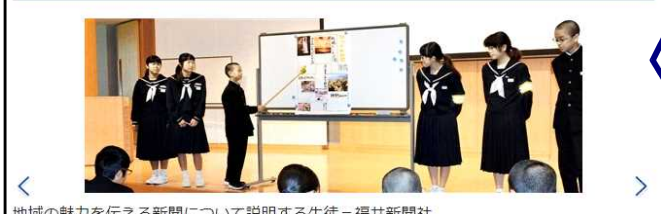
地域の魅力を伝える新聞について説明する生徒

地域の魅力 紙面に凝縮 国見、越廼、殿下 3中学が合同制作 みんなの新聞 NIE 教育