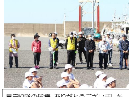
見守り隊の皆様、ありがとうございました。