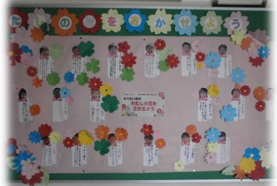
児童玄関「つつける努力 かがやく未来」目標掲示

今学期も、本校の教育活動への保護者の皆さまのご理解とご協力をどうぞよろしくお願いいたします。