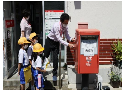
6月 低学年生活科町探検で施設巡り