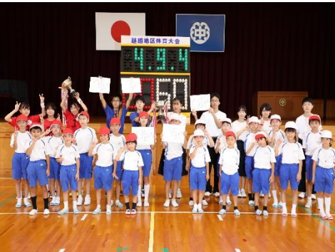
9月 盛り上がった校内体育大会