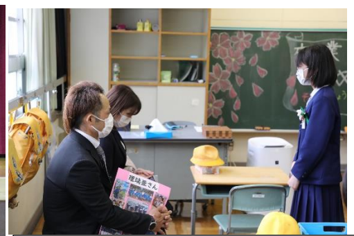
教室で卒業生から家族に感謝の言葉