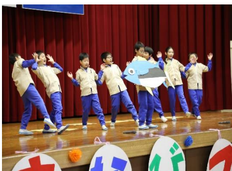
12月 学びフェスタ 越廼探検隊