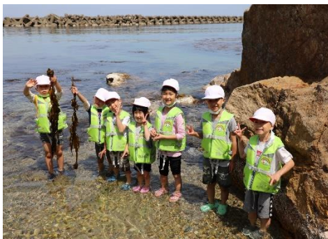
5月 越廼を実感したわかめ採り