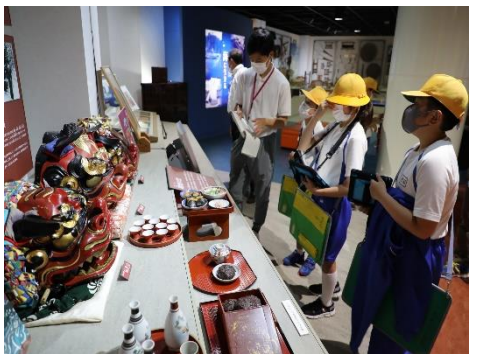
7月 高学年ふるさと資料館見学