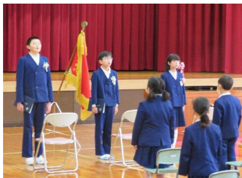
在校生と卒業生 お別れの言葉