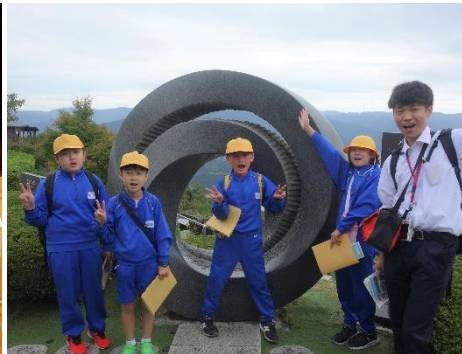
9月 高学年 若狭小浜への修学旅行