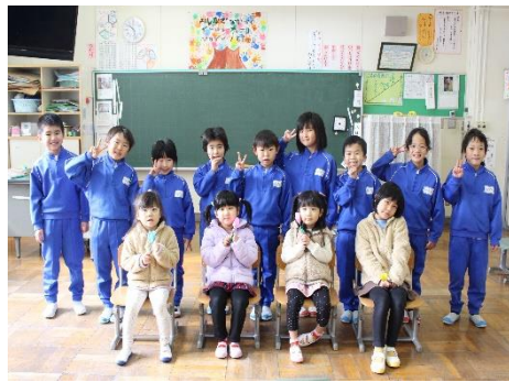
2月 曙保育園とのなかよし遊び

卒業式を終えて各学年では1つ上の学年に進級したつもりで残りの日々を過ごしていきます。「ひとりで歩く みんなと歩く 力の限り歩く」を意識して、 自分で考えて行動する低学年 、 みんなと協力しながら活動する中学年 、そして 全校の手本としてまたみんなのために精一杯のがんばりを見せる高学年 と全校児童 21名と少人数ながら一人一人にそれぞれに応じた指導と支援と一緒に歩む教職員 12名で今年も素晴らしい成果と輝かしい思い出が残せた1年間でした。新型コロナに負けずに、子供達と共に前向きに取り組めた1年間となりました。