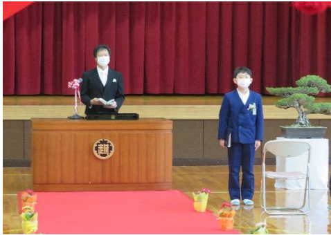
校長先生からの式辞と卒業生紹介