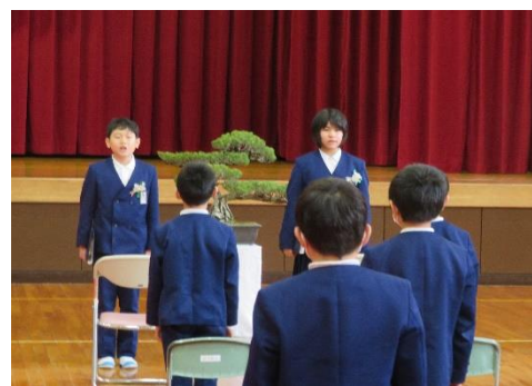
全校揃って合唱「旅立ちの日」