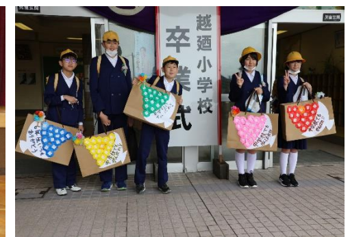
最後に児童玄関前で集合写真