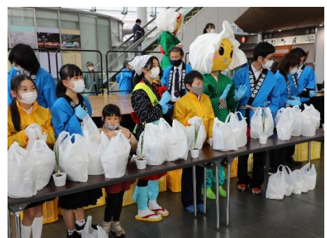
11月 中学年福井駅前で水仙配布