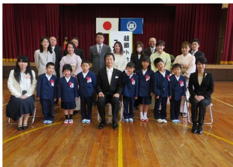
4月 新1年7名を迎え入学式