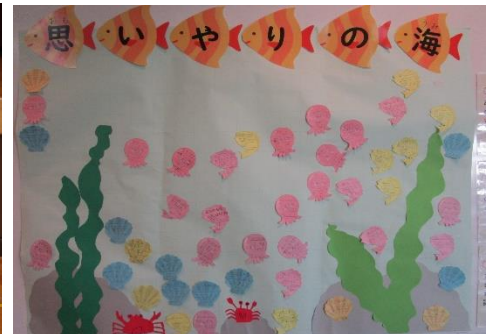
児童玄関前掲示「思いやりの海」