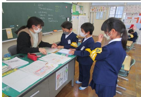
先生も話を聞いて褒めて認めて