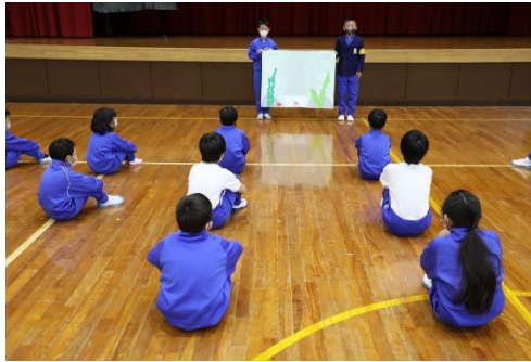
全校集会で「思いやりの海」取組説明

12月に入り月目標「感謝の気持ちを持とう」と合わせて、人権週間の取組としてヘルシー・環境委員の呼びかけで掲示板「思いやりの海」が設置されました。これはありがたいと思ったことの中で、自分も「まねしたい」「うれしかったこと」「心が温かくなったこと」をそれぞれ海の生き物鯛、蛸、貝をかたどったカードに書いて、全校児童で貼り付けていくものです。学級でもそれぞれ取組の時間を取り、カードを書き上げていることもあり、あつという間に思いやりの海に多くの生き物が泳ぎ回っています。他にも保健室前の「みんなのよさを認め合おう」低学年教室の「ふわふわ言葉・チクチク言葉」などの掲示物などでみんなが優しく、安心して過ごせる学校づくりに全校挙げて取り組んでいます。保護者懇談会などで来校の際には、校内掲示物もじっくりとご覧ください。