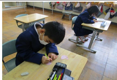
1年 学級でもカード記入の取組