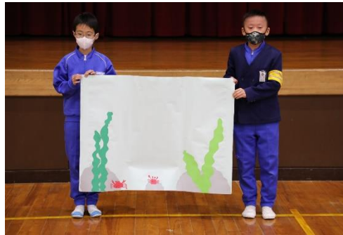
3種類のカードを貼り付ける台紙