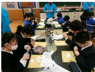
3・4年「磁石の不思議」

日本原子力研究開発機構敦賀営業本部の方々に、理科の出前授業をしていただきました。3・4年生は磁石のさまざまな性質について学習し、磁石を利用したミニカーを作って走らせる活動をしました。5年生は電磁石のはたらきを利用したモーターはどのような仕組みで回るのかを学び、実際にコイルでモーターを作りました。どちらも楽しみながら学ぶことができました。