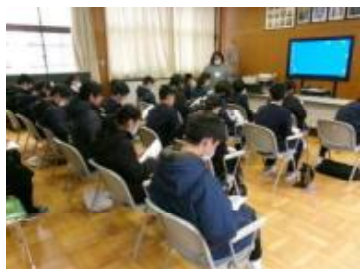
生活・学習についての説明