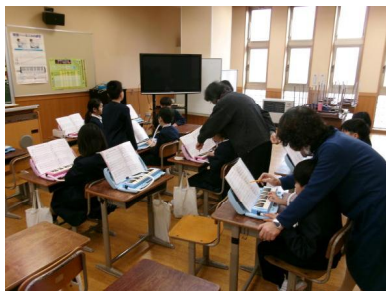
3年 音楽 鍵盤ハーモニカ