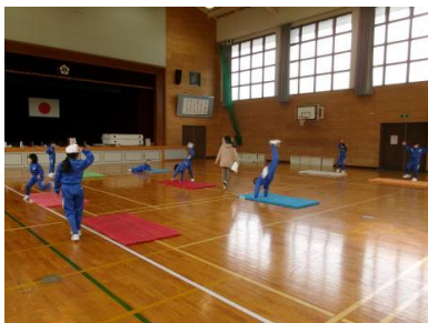
1・2年 体育 マット運動