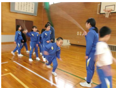
縦割り班で大縄跳び