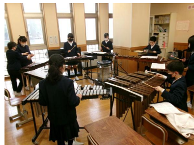
4年 音楽 マリンバ