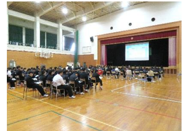
【 進学説明会 】

保護者のみなさまが中学生の頃とは、生徒の学びが変化しています。2021年度から文部科学省が定める教育課程の基準である学習指導要領には、「これからの社会が、どんなに変化して予測困難になっても、自ら課題を見付け、自ら学び、自ら考え、判断して行動し、それぞれに思い描く幸せを実現してほしい。そして、明るい未来を、共に創っていきたい。」という願いが込められています。そこで川西中学校では、未来を生きる生徒を育成するため、教職員は日々授業改善に取り組んでいます。これこそが、教職員の本来の職務です。