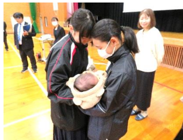
【 命の授業 】