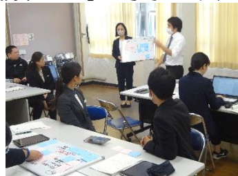
【 研究会 全体共有 】