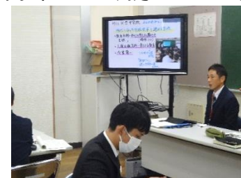
【 指導主事より 】