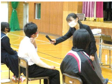
【 命の授業 】

さて、今年度も4か月あまりとなりました。先日11月11日の「授業公開・PTA 研修会・部活動見学会および懇談会」に、多くの保護者のみなさまが来校し、授業参観していただき、ありがとうございました。本校の研究主題「自律的な学びの創造 ～教師の支援の視点から～」に則った日々の教育活動を参観されて、いかがでしたでしょうか。