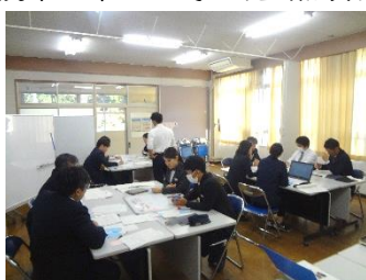
【 研究会 グループ討議 】

「今年の全国学力・学習状況調査の結果（福井市教育委員会より）によりますと、川西中学校の3年生は『人の役に立つ人間になりたい』と、100%の生徒が回答していました。100%の生徒がこのように回答することは、大変すばらしいことです。川西中学校は、人権を徹底的に重んじる教育、授業第一、時代に合った学校改革をすすめる学校ですね。」と高く評価をしていただきました。研究会では、教職員が提案授業と普段の授業について活発に議論し、自律的な学びの創造の授業づくりをめざしていました。その研究会のやりとりも含め、指導主事の先生からは、「川西中学校はお若い先生方も発言がしっかりしていて、学ばれている様子がうかがえます。」とお褒めの言葉をいただき、教職員が授業を第一に考え、重点項目「わかる授業づくり」に邁進する取組を今後も実践していく決意をしました。