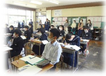
[ 1年生 授業参観 ]

新型コロナウイルス感染症は令和5年5月8日付けで、感染症の予防及び感染症の患者に対する医療に関する法律上の5類感染症に移行するとされており、これまで3年余に及んだ感染症との戦いにひとつの節目を迎えることとなります。学校教育活動については、引き続き健康観察や換気の確保、手洗い等の手指衛生の指導等が重要ですが、毎日の生徒の体温等を学校に提出することは不要です。マスク着用を求めないことが基本となること、学校給食の場面では「黙食」は必要なし、となりました。