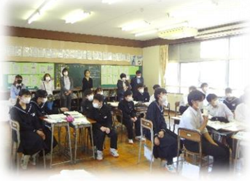
[ 2年生 授業参観 ]