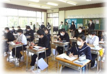
[ 3年生 授業参観 ]

4月下旬に実施しました「授業参観・PTA総会・学年懇談会」では、保護者のみなさまが多数来校され、お子様の授業の様子や学級の様子を参観されましたこと、大変うれしく感謝申し上げます。新学期がスタートし、生徒は新たな気持ちで学習に励み、落ち着いた学校生活を送っています。