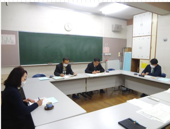
【家庭・地域・学校協議会】