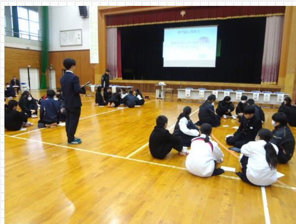
【異学年18班で話し合い】