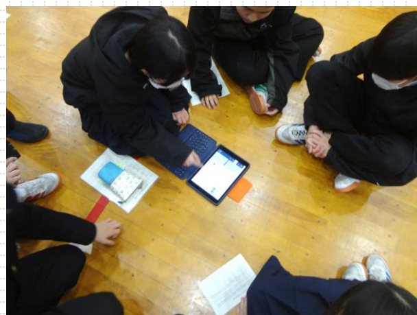
【ICTの時代 記入ボードなし】