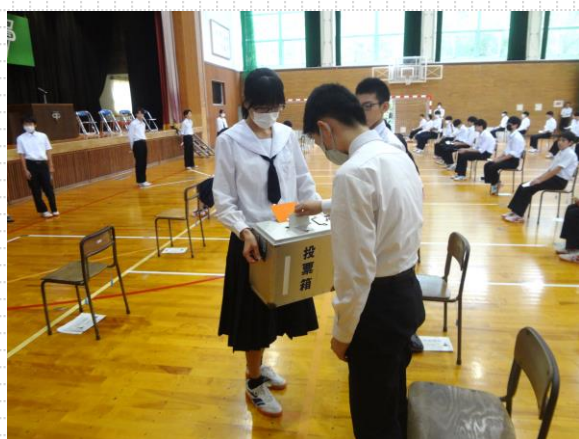
【1年生は初めての投票】