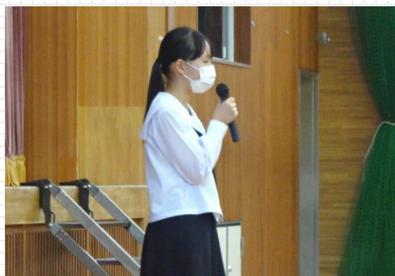
【選挙管理委員長の話】

立候補者は公約と抱負をしっかりと演説しました。役員選挙は生徒自らが選挙管理規則に則り、運営していました。