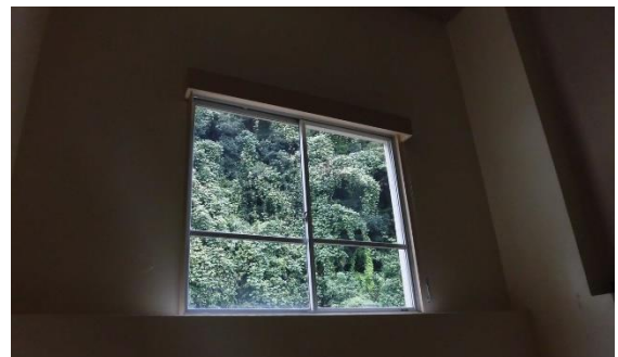
外の緑がすっきりと見えます！

さらには、続けて奉仕作業を行い、学校の中の様々なところをきれいにさせていただきました。子どもたちと教職員だけでは行き届かないところもあり、保護者の皆様のお力によりきれいになりました。これからも、子どもたちとともに校舎を大切に使用していきたいです。