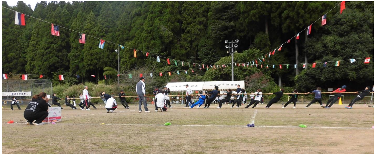
綱引き大会の様子 大迫力でした

◆◆◆ 一学期のふり返りから ◆◆◆ 一学期みんなががんばったこと、できるようになったこと