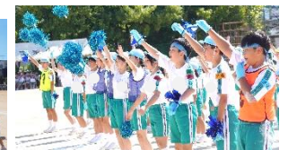
チェッコリ玉入れ