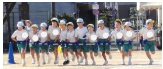
③4年 かけ算タイフーン