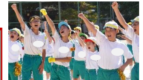
⑩応援合戦：上から赤・青・黄

クロージングセレモニーの際の子どもたちの顔には、やり遂げた満足感が見られました。6年生が中心となって、スローガン「一人一人が全力を出して思い出に残る運動会にしよう Let's enjoy!」を実行した、立派な姿が、本校の歴史に刻まれました。クロージングセレモニーの後には、各色の団長と応援団長からの言葉が伝えられました。これまでのお礼の言葉や思いを聴いて、涙する子もいました。本番まで練習をしながら積み重ねてきた色ごとの団結力が、子どもたちをより成長させてくれました。