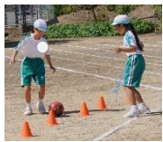
⑪5年 宝永リンピック