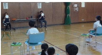
<視力検査をする子どもたち>

尿検査はすでに終了しています。他にも、歯科検診・内科検診(高学年は終了)・心電図検査(1・4年)・色覚検査(4年希望者)が予定されています。検査や検診の結果、病気や異常の疑いがある場合は、学校からお知らせしますので、早めに病院を受診して、治療を進めてください。お子様の健康の保持増進のために、よろしく願います。