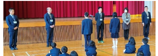
<新任式での「児童代表歓迎の言葉」>

また、子どもたちには、新しい学年で、担任や仲間と一緒に充実した学校生活を過ごし、大きく成長する1年であってほしいと思います。教職員一同、気持ちを新たに、一致団結して頑張っていきます。それぞれのクラスで、どんな物語が創り上げられるか、楽しみです。心に残る、すばらしい物語が創り上げられることを期待しています。