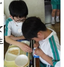
<6年生から片付け方を教わる1年生>

1年生の給食も始まりました。給食当番が配膳をした後、子どもたちは、おいしそうに食べていました。お代わりをする子もいて、きれいに食べ切ることができました。給食時間の終わり頃には、6年生の子どもたちが、片付け方を教えに来てくれました。牛乳パックのたたみ方や食器の片付け方などを優しく丁寧に教えてくれていました。温かい言葉がけをしてくれる6年生の子どもたちの姿に、成長を感じました。最上級生としての自覚をもって行動できる6年生の子どもたちに、頼もしさも感じました。