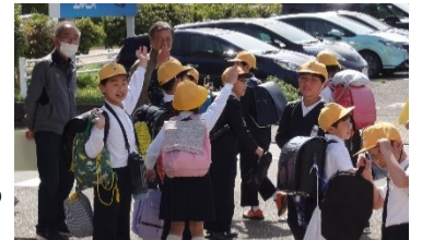
<一斉集団下校指導の様子>

町内割り当ての各教室に集まって、年度始めの初顔合わせとなる町内子ども会を行いました。班長は、1年教室へ1年生の子どもたちを迎えに行ってくれました。まず、マップで通学路と危険箇所・かけこみ110番などを確認しました。メンバーの確認と並び方の確認もしました。そして、集合場所や集合時刻、集団登校時の注意事項を確認しました。1年生の子どもたちにとっては初めてのことなので、歩き方も丁寧に確認しました。