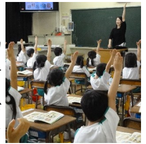
<1年教室の授業の様子>

入学式の翌日から、1年生の学校生活が順調に始まりました。登校してきた子どもたちは教室へ行き、まず、提出物を出してから学習用具を机に入れ、ランドセルをロッカーにしまします。そして、体操服に着替えます。その際、ハンカチなどは体操服のポケットに入れ替えます。どの子どもだんだん上手にできるようになり、始業時刻の8時5分には全員が着席しています。授業では、聞き方や話し方、鉛筆の持ち方、集団生活でのきまりなどを一つ一つ身に付けていきます。子どもたちは、様々なことを自分でやり遂げようと頑張っています。