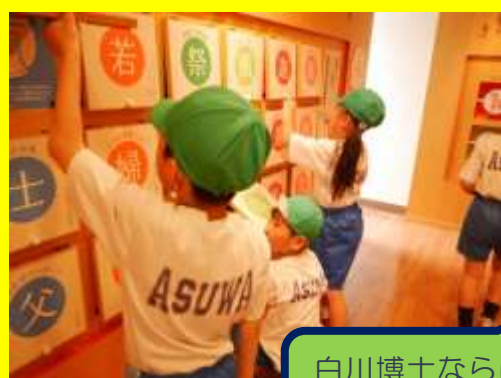
白川博士ならぼくたちも勉強してきたよ！