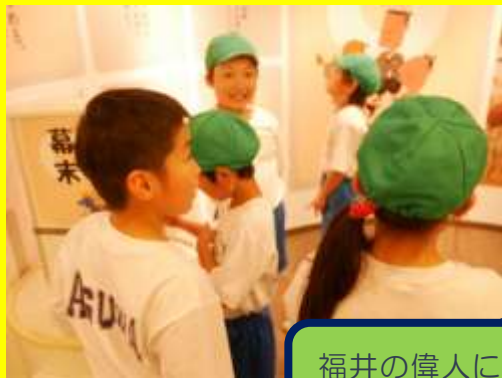
福井の偉人についてのクイズに挑戦！