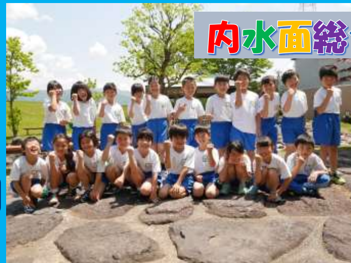
内水面総合センター