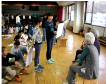
6年生 デイホームでの発表とゲーム