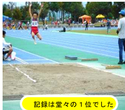
記録は堂々の1位でした

9月20日(木)に、大野市の奥越ふれあい公園陸上競技場で第67回目の福井市小学校連合体育大会が行われました。今年は、国体があり県営陸上競技場が使えないため大野市での開催となり、6年生のみの出場でした。午後からは雨模様となりましたが、選手種目や選手以外の児童が出場するチャレンジタイム(50m走、ボール投げ、走り幅跳び)では、児童は全力で頑張りました。