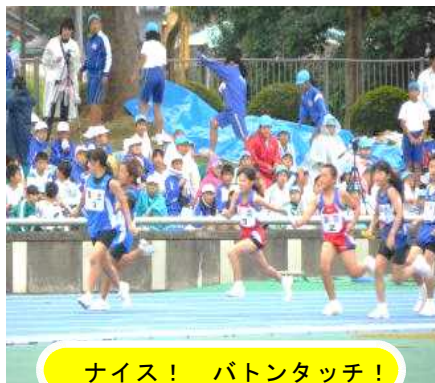
ナイス! バトンタッチ!