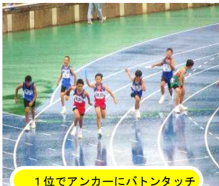
1位でアンカーにバトンタッチ