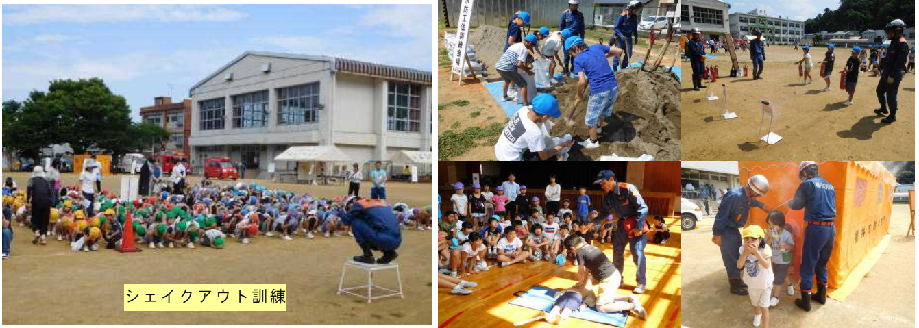
シェイクアウト訓練

6月24日(日)に、福井市の防災訓練がありました。今年は福井市南消防署の推進地区が足羽地区ということで、本校も授業日とし、児童も貴重な体験をいくつもさせていただきました。保護者の皆様、地区の皆様、ありがとうございました。