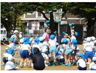
みどりこども園、ひまわりこども園、西光寺保育園の園児と協力しての玉入れでした。