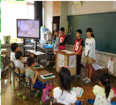
各班での事前説明会

1年生から6年生までの縦割り班で活動する「足羽山集会」を行いました。この日のために5、6年生が中心になって準備を進め、当日は、高学年児童が低学年児童にやさしく声かけをしたり、一緒に遊んだりする姿がよく見られました。