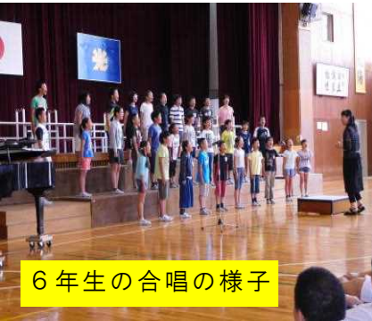
6年生の合唱の様子

13日(火)に光陽中学校で小中合同の連音発表会がありました。湊小学校や東安居小学校、光陽中学校の合唱を聴いて、6年生も新たな意欲がわいてきたようです。