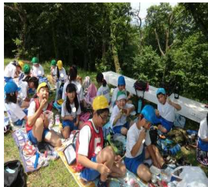
みんなで昼食タイム