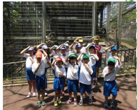
みんなで「お猿」のポーズ