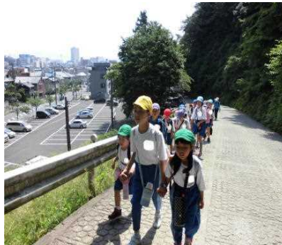
あじさいの道から