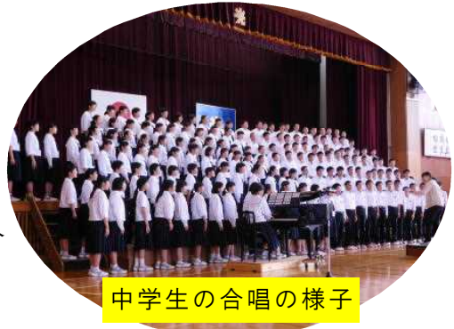
中学生の合唱の様子

13日(火)に光陽中学校で小中合同の連音発表会がありました。湊小学校や東安居小学校、光陽中学校の合唱を聴いて、6年生も新たな意欲がわいてきたようです。