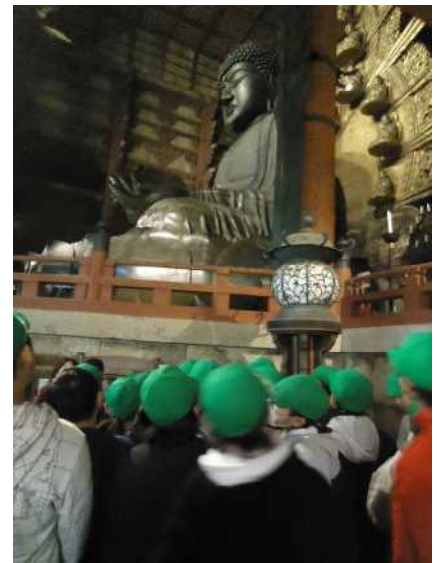
大仏の大きさに感動