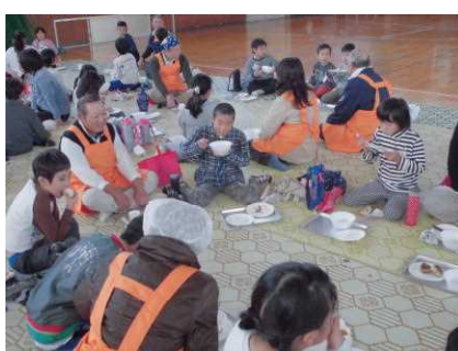
円くなって楽しく会食