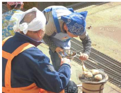
七輪での火起こしと焼きおにぎり作り