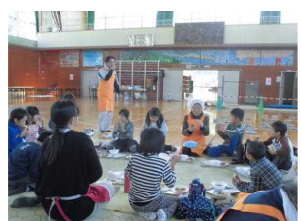
おかわりもいっぱいしました