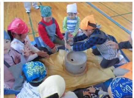
炒った大豆をひいてきな粉作り