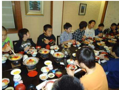
みんなで食べる食事は格別