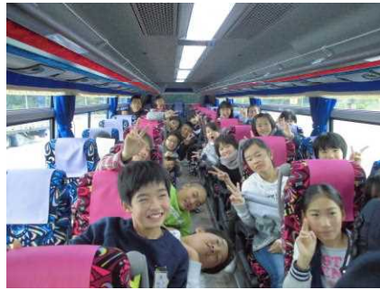
バスの中での楽しいレクリエーション