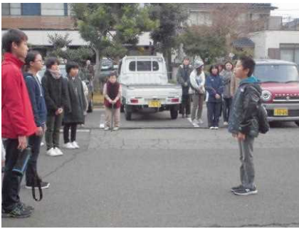
大勢に見送られての出発式