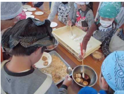
黒蜜ときな粉を付けてあべかわ作り