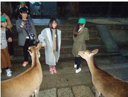
おそろおそろ鹿にせんべいを