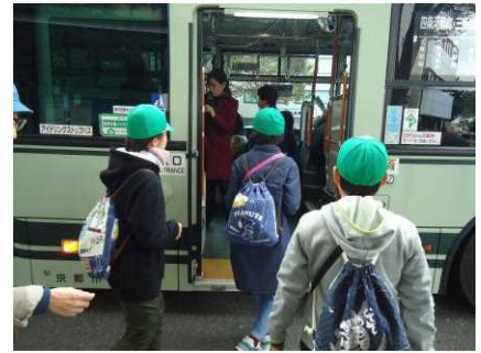
京都市内班別行動