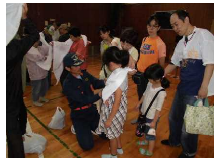
三角巾で応急手当の講習