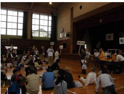
地区ごとにプラカードを持って避難

足羽地区の防災訓練に小中学生も多数参加しました。訓練の開始を告げるサイレンと緊急放送を合図に、近くの一次避難所に避難した後、さらに足羽小学校体育館に地区ごとに避難してきました。応急処置や簡易担架作り、AEDなどの講習会も行われました。