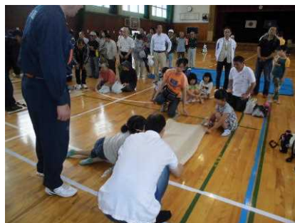
物干し竿と毛布を使って担架作り講習