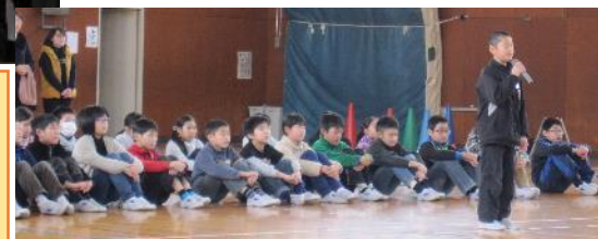
5年生 No.1 1 3月

「6年生を送る会」の計画や準備は、とても大変でしたが、5年生にとって、とてもやりがいのある行事でした。次は、私たちが、最高学年としてがんばります。