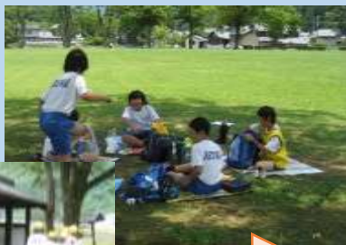
お弁当もおいしかった！