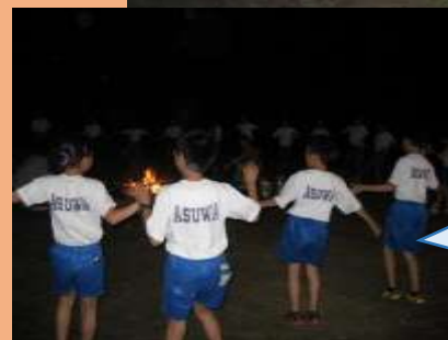
みんなで元気にマイムマイム「マイム足羽！」