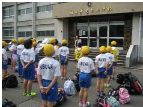
出発式で教頭先生にごあいさつ。

福井市少年自然の家で宿泊学習を行いました。協力すること、ルールを守ることの大切さを学びました。みんなで楽しい宿泊学習を作り上げることができました。