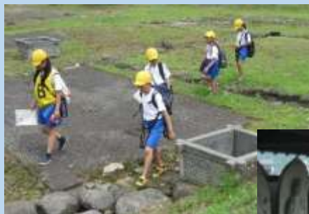
問題を解きながら、たくさんさんの遺跡を回りました。