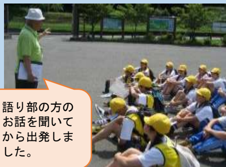
語り部の方のお話を聞いてから出発しました。