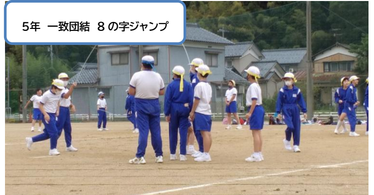
5年 一致団結 8の字ジャンプ