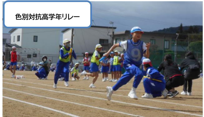
色別対抗高学年リレー