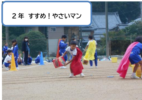
2年 すすめ! やさいマン