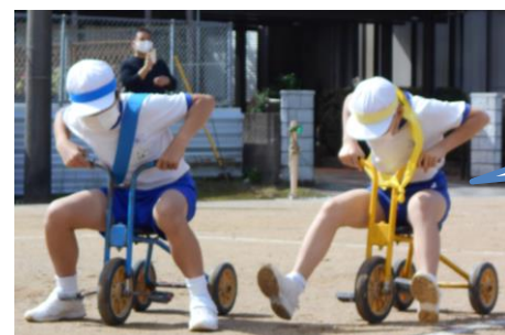
6年 イロドリリレー