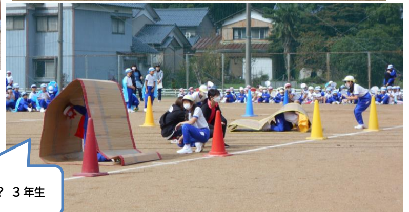
3年 はらぺこ あおむし? 3年生