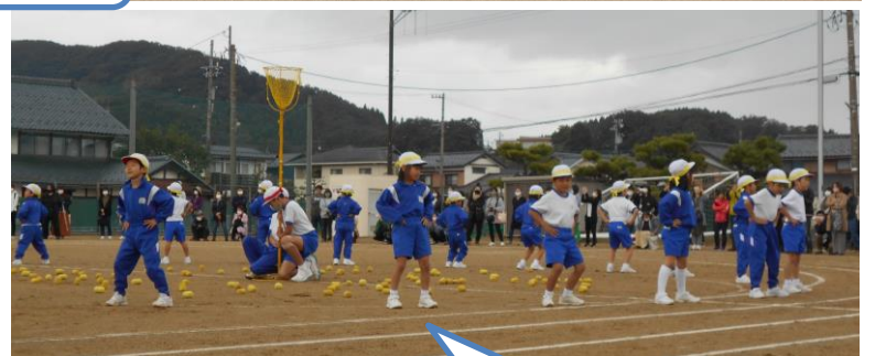
1年 なかよしチェッコリ玉入れ