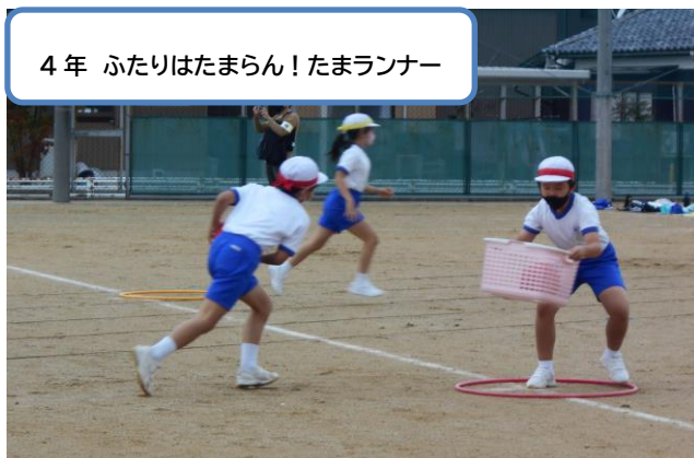
4年 ふたりはたまらん! たまランナー