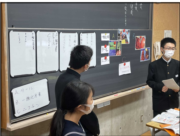
タバコによる害の写真とクイズを合わせた内容に改善し、クイズも各班にホワイトボードに書かせてみんなで共有