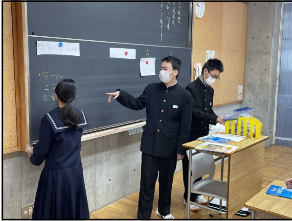
キーワードのカードを使って授業する様子

プレ授業の反省を元に授業改善を行った喫煙と健康チームは準備をしっかりと行い、本授業に臨んだ。