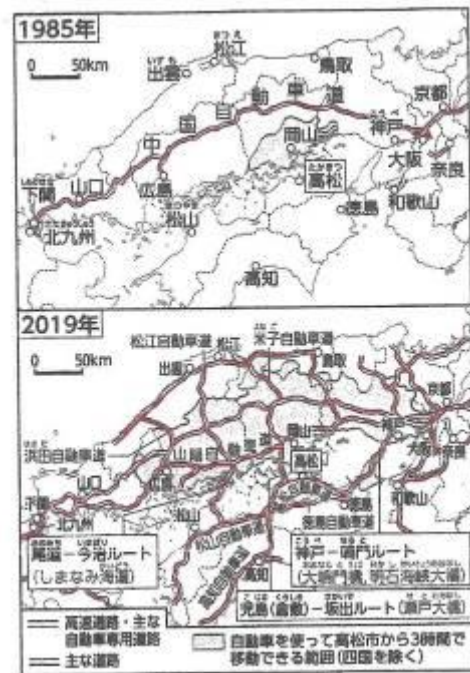
資料「中国・四国地方における高速道路網と所要時間の変化」