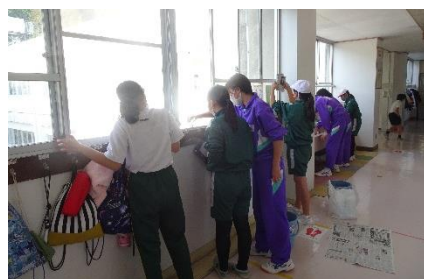
掃除をしている様子