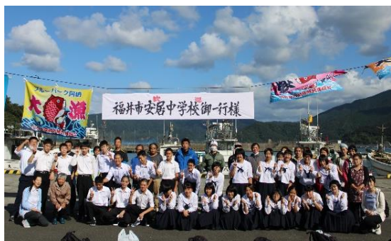
私たちが温かく迎えて下さった阿納の方々

例年、3年生は修学旅行で関東地方へ赴き、企業訪問や都内班別活動などを行っている。しかし、今年度は新型コロナウイルス感染症の影響により、福井県小浜市へ1泊2日の修学旅行となった。2日間の様々な活動を通して、生徒達の心に一番残っていることは、「阿納の方々の温かさ」や「人と人とのつながり」であった。地区の方々が私たちを家族のように迎え入れてくださり、その「家族のような温かさ」をこの安居地区の方々にも感じてもらいたい、自分達はその架け橋になりたい、と考え、「Bridge～おかえりなさい安居～プロジェクト」が始まった。