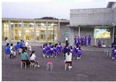
ホタル観察会 Firefly observation meeting