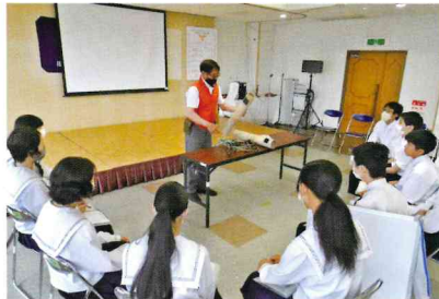
地域に関する調査活動 Research activities to explore local problems