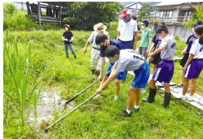
ミズアオイの植え替え Replanting Monochoria korsakoi to biotope