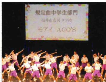
リズムダンスコンテスト Rhythmical dance contest