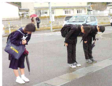
校門の前での礼 Bowing at the school gate