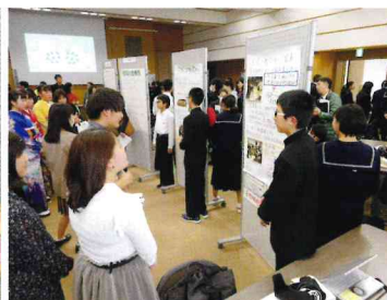
福井大学でのポスターセッション Poster presentation session at Fukui Roundtable