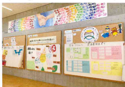
入学年度毎の掲示板 Grade bulletin board for the years