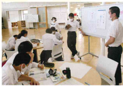
教科エリアを使った学び Learning with the subject areas