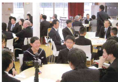
生徒が参加する授業研究会 Student-engaged lesson study meetings