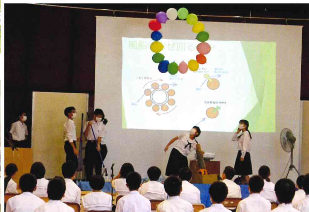
学校祭 School Festival