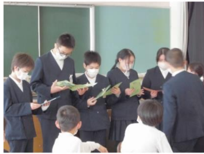
【メッセージカード渡し】