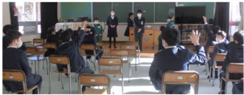
【ジェスチャーゲーム】