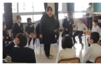
【フルーツバスケット】