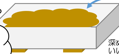
下に木切れを入れる。

花や野菜は毎日見て声をかけてやるとよく育つと言われます。手をかけて愛情をたっぷり注ぐのは、子育てと一緒にですね