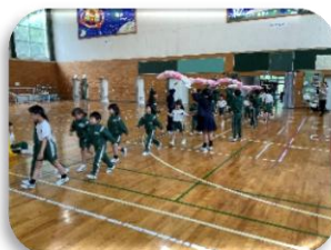
みんな笑顔で入場!

5月1日に「1年生を迎える会」が行われました。体育館で新1年生18名を迎え、温かな雰囲気の中、クイズやじゃんけん列車などで楽しみ、5年生からのプレゼントもありました。お返しに1年生はお兄さんお姉さんの前で、音楽に合わせて元気にダンスを踊りました。これからも1年生から6年生みんなで作って学校生活を送ってほしいと思います。