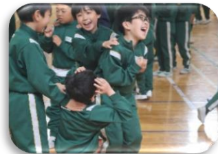
じゃんけん列車は盛り上がりました