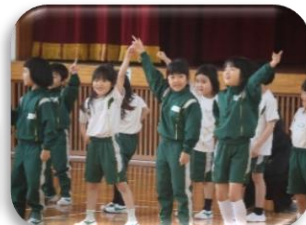
1年生はかわいいダンスを披露してくれました